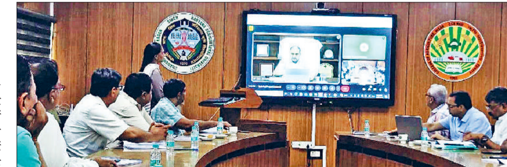
हिसार। एचएच के कार्यक्रम में उपस्थित अधिकारी।

कुलपति ने वैज्ञानिकों को रासायनिक कीटनाशकों पर निर्भरता घटाकर जैविक एवं पर्यावरण-अनुकूल