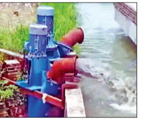
हिसार। पंपसेट लगाने पर नहर में डाला जा रहा ड्रेन का पानी।

जिले के सिंचाई विभाग के अधिकारियों की बड़ी कारस्तानी सामने आई है। विभाग ने चार स्थानों पर पंपसेट लगाकर सीवर का पानी नहरी जल में मिलाया जा रहा है और यह दूषित पानी हिसार व भिवानी जिले के 100 से अधिक गांवों के जल घरों तक पहुंच रहा है। सिंचाई विभाग के इस कार्य का बालसमंद क्षेत्र के किसान संगठनों ने कार्य का विरोध किया है। किसानों ने उपायुक्त और सिंचाई विभाग के अधिकारियों से मिलकर इसे तुरंत बंद करने की मांग की है। किसान