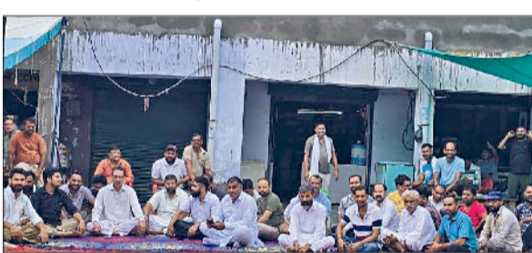
सिरसा। गांव चौटाला में धरने पर बैठे दुकानदार।

क्षेत्र के गांव चौटाला में सड़क निर्माण की मांग को लेकर दुकानदारों ने बुधवार को धरना दिया और प्रदर्शन किया। दुकानदारों ने बताया कि पाइप डालने के लिए सड़क को तोड़ा गया लेकिन बाद में इसकी किसी ने सुध नहीं ली। इसके कारण दुकानदारों का कामकाज ठप हो गया। बरसात में तो स्थिति वद से बदतर हो गई। अब परेशान दुकानदार आंदोलन के लिए मजबूर हो गए। दुकानदारों के धरने को अन्य ग्रामीणों ने भी समर्थन दिया। क्षेत्र के दुकानदारों ने बताया कि तीन-चार महीने पहले पाइप लाइन डालने को लेकर सड़क को खोद दिया। अब बरसाती सीजन में सड़क किनारे खोदे गए गड्ढों में पानी जमा हो गया है, जिससे वाहन चालकों के साथ-साथ स्थानीय