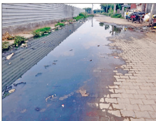
फतेहाबाद। अशोक नगर में सड़कों पर फैला सीवरज का गंदा पानी।