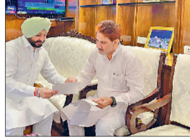
को बेहतर रेल संपर्क विस्तार की आवश्यकता लंबे समय से महसूस की जा रही है। राज्यसभा सांसद सुभाष बराला ने टोहाना और जाखल रेलवे स्टेशनों को क्षेत्र की जीवनरेखा बताते हुए कहा कि यह स्टेशन न केवल नागरिकों की दैनिक आवाजाही का केंद्र है, बल्कि व्यापारिक गतिविधियों, कृषि उपज के परिवहन तथा विद्यार्थियों की शैक्षणिक यात्रा के लिए भी अत्यंत महत्वपूर्ण भूमिका निभाते हैं। उन्होंने कहा कि यह केवल क्षेत्रीय विकास की दृष्टि से महत्वपूर्ण है,

राज्यसभा सांसद श्री सुभाष बराला ने बुधवार को केंद्रीय रेल राज्य मंत्री श्री रवनीत सिंह बिट्टू से भेंट कर टोहाना और जाखल क्षेत्र से संबंधित विभिन्न रेल विकास कार्यों को लेकर विस्तार से चर्चा की। बैठक के दौरान सांसद श्री बराला ने टोहाना और जाखल की जनता को बेहतर रेल सुविधाएं उपलब्ध करवाने के उद्देश्य से अनेक जरूरी सुझाव और मांगें रखीं।