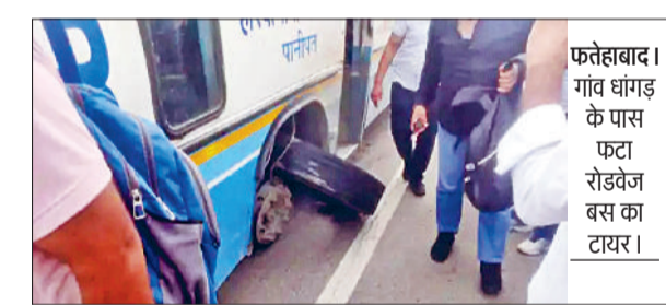
फतेहाबाद। गांव धांगड़ के पास फटा रोडवेज बस का टायर।

नेशनल हाइवे 9 हिसार रोड पर स्थित गांव धांगड़ के पास बुधवार सुबह उस समय बड़ा हादसा होते-होते टल गया जब सवारियों से भरी एक रोडवेज बस का टायर अचानक तेज धमाके के साथ फट गया। धमाके की आवाज सुनकर यात्रियों में हड़कंप मच गया। धमाका होते ही झड़वर ने बस की स्पीड स्लो की और उसे साइड में किया, जिस वजह से बस पलटने से बच गई और किसी को चोट नहीं आई। घटना हाइवे पर स्थित धांगड़ गांव में प्लानेटाओवर की है। रोडवेज बस पानीपत डिपो की थी, जो सिरसा जा रही थी। झड़वर की सूझबूझ से बड़ा हादसा टल गया। इसके बाद दूसरी बस मंगाने सवारियों को आगे के लिए रवाना किया गया। रोडवेज