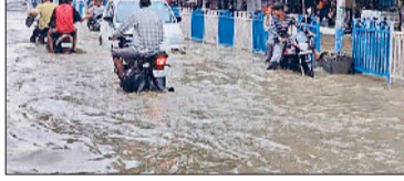
शहर में बरसात के बाद हुए जलभराव का दृश्य।