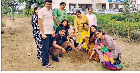
फतेहाबाद। पौधारोपण करते नई उम्मीद व जीव सेवा ट्रस्ट सदस्य व अतिथिगण।