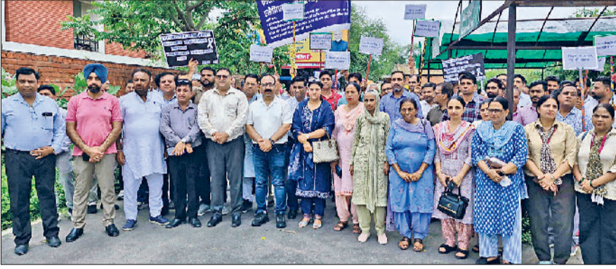
सिरसा। प्राइवेट स्कूल संचालक डीसी कार्यालय के समक्ष प्रदर्शन करते हुए।