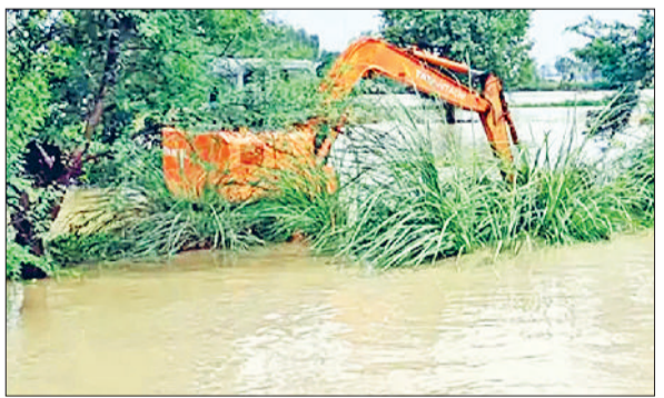
नारनौद। जेसीबी की सहायता से दरार पाटने का प्रयास करते कर्मचारी।