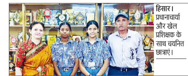
हिसार। प्रधानाचार्या और खेल प्रशिक्षक के साथ चयनित छात्राएं।

दोनों छात्राओं ने हाल ही में रोहतक में आयोजित चयन ट्रायल्स में भाग लिया, जहां उनके शानदार प्रदर्शन के आधार पर उन्हें टीम में जगह दी गई। राष्ट्रीय स्तर की यह प्रतिष्ठित प्रतियोगिता आगामी 23 जुलाई से