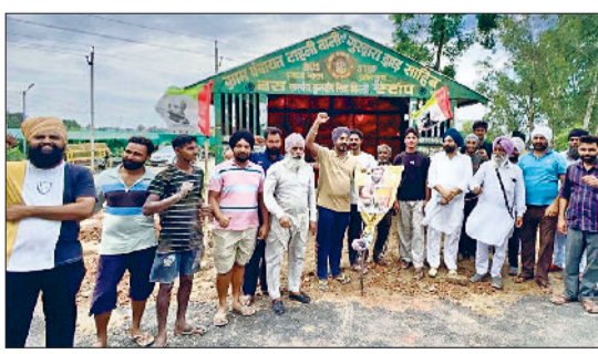
फतेहाबाद। झाड़ साहिब में सरकार के खिलाफ प्रदर्शन करते किसान।

प्रदेश सरकार किसानों को पर्याप्त मात्रा में डीएपी खाद उपलब्ध करवाने में नाकाम रही है जबकि निजी व्यापारियों के गोदाम खाद से भरे पड़े हैं और सरकार को शह पर निजी व्यापारी खाद की ब्लैक कर दोनों हाथों से किसानों को लूटने में लगे हैं। पगड़ी संभाल जट्टा किसान संघर्ष समिति इसे किसी कीमत पर सहन नहीं करेगी। अगर सरकार ने जल्द ही खाद की ब्लैक करने वालों पर कार्रवाई नहीं की और किसानों को पर्याप्त मात्रा में खाद उपलब्ध नहीं करवाई तो किसान सड़कों पर उतरने को मजबूर होंगे। यह बात पगड़ी संभाल जट्टा किसान संघर्ष