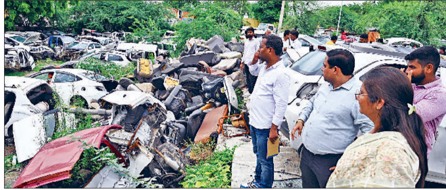
हिसार। ऑटो मार्केट फेस-3 में दुकानदारों द्वारा किए गए अतिक्रमण को देखती अतिरिक्त आयुक्त शालिनी चेतल।

घटना के समय अतिरिक्त आयुक्त शालिनी चेतल और अतिरिक्त निगमायुक्त डॉ. प्रदीप हुड्डा समेत निगम के अधिकारी व